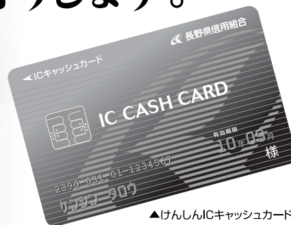
▲けんしんICキャッシュカード