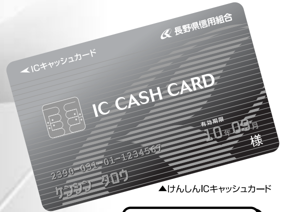
▲けんしんICキャッシュカード