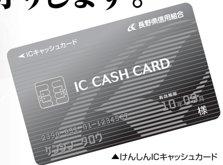
▲けんしんICキャッシュカード