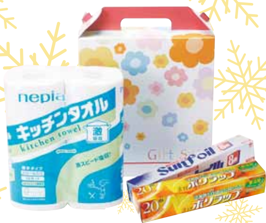
キッチンギフトセット